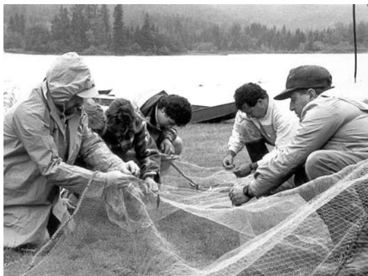
Quelques experts procédant à l'inventaire et l'identification des prises dans le filet.