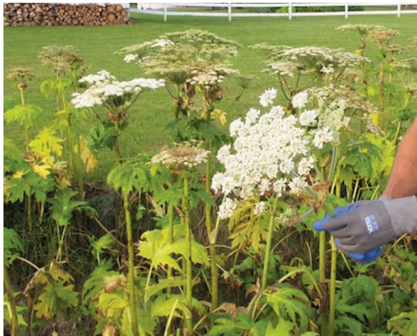
La Berce du Caucase, à manipuler avec grande précaution, peut atteindre des proportions imposantes.

http://www.msss.gouv.qc.ca/sujets/santepub/environnement/index.php?berce-du-caucase