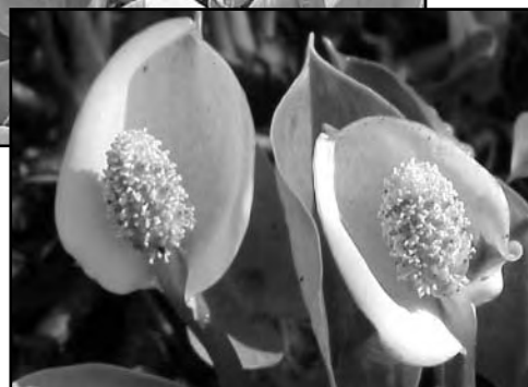
Le calla des marais forme de belles colonies

Aussi, j'ai remarqué un rubanier, probablement le rubanier à feuilles étroites. Le rubanier est aussi une herbacée vivace à rhizome, croissant en colonies. Ces longs rubans étroits sont couchés sur l'eau. Toutefois, il supporte bien l'exondation et hors de l'eau, il se tient droit!