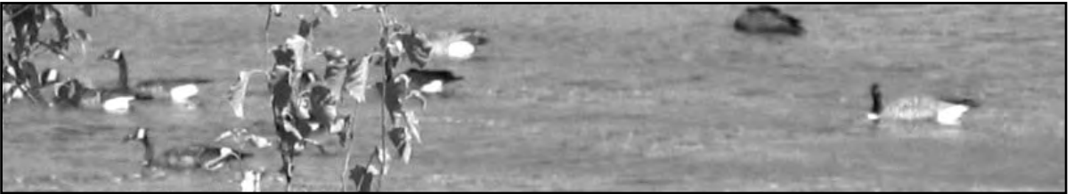
Photo prise le dimanche 23 septembre. À ce moment, une dizaine d'outardes étaient présentes au lac.