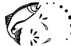
Ensemencement de 500 truites mouchetées de 9 à 12 pouces, le 3 juin 2001