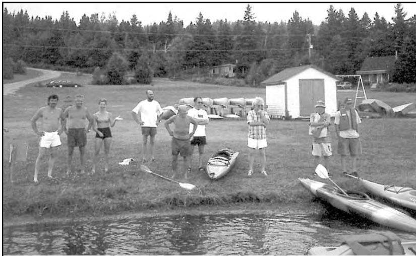
Journée «plein air kayak»