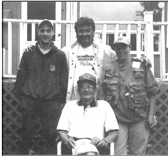
Tournoi de pêche «Rodolphe Gervais»