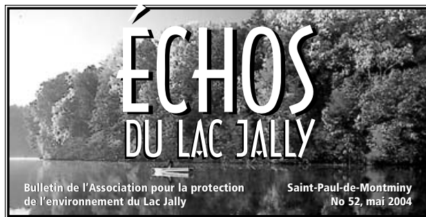
Le «look» des entêtes du bulletin depuis 1983.